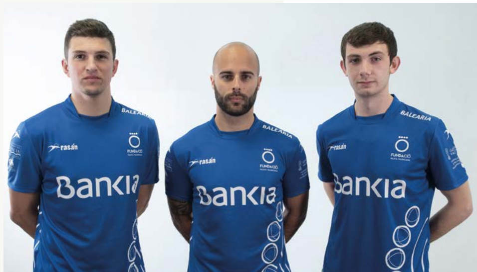
Gabi, Brisca i Montaner